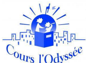
Le cours L'Odysée à Angoulême (16)

En septembre trois nouvelles écoles sont venues grossir les rangs du réseau Espérance banlieues :